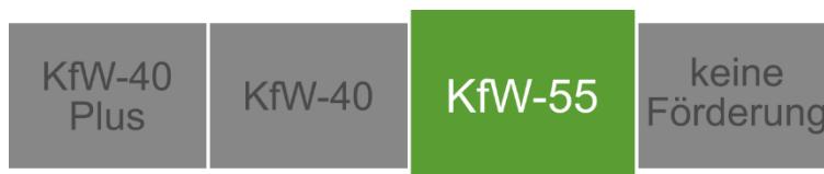
Bild: Erreichter KfW-Effizienzhausstandard

Mit dem geplanten Neubau kann ein KfW-Effizienzhaus 55 erreicht werden. Damit können Sie das KfW-Förderprodukt Energieeffizient Bauen 153 in Anspruch nehmen.